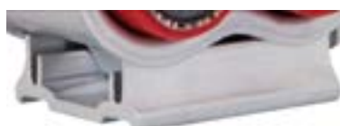
BASE DE ALUMÍNIO