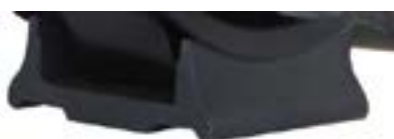
BASE DE POLÍMERO (WITH POLYESTER COATED FRAME)