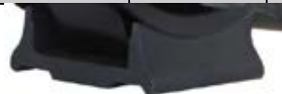
POLYMER-BASIS (WITH POLYESTER COATED FRAME)